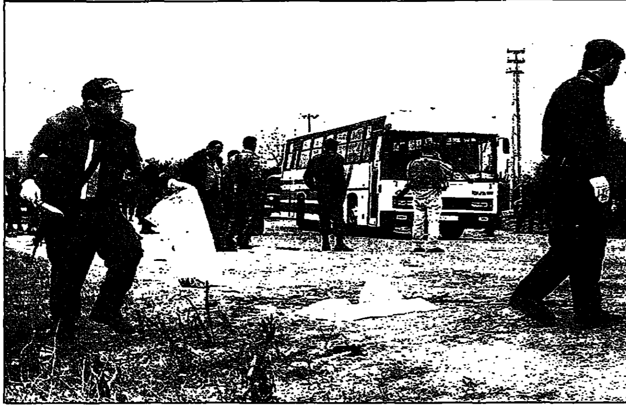
قوات شرطة اسرائيلية واخرى فلسطينية تتفقد موقع الانفجار امام مستوطنة نتساريم امس

مدى التعاون الحثيث بين الشرطة الفلسطينية والارهابيين، وقال زعيم المستوطنين في قطاع غزة انه كان على اسرائيل ان ترد ان كان الهجوم قد نجح ومضى بقول ان الهجوم كان مدياً بترام من جرحوا في العملية الهجومية. وقال زعيم مستوطنات غوش قطيف انه اذا نجح الهجومان على حافلتين فربما قتل 100 شخص.